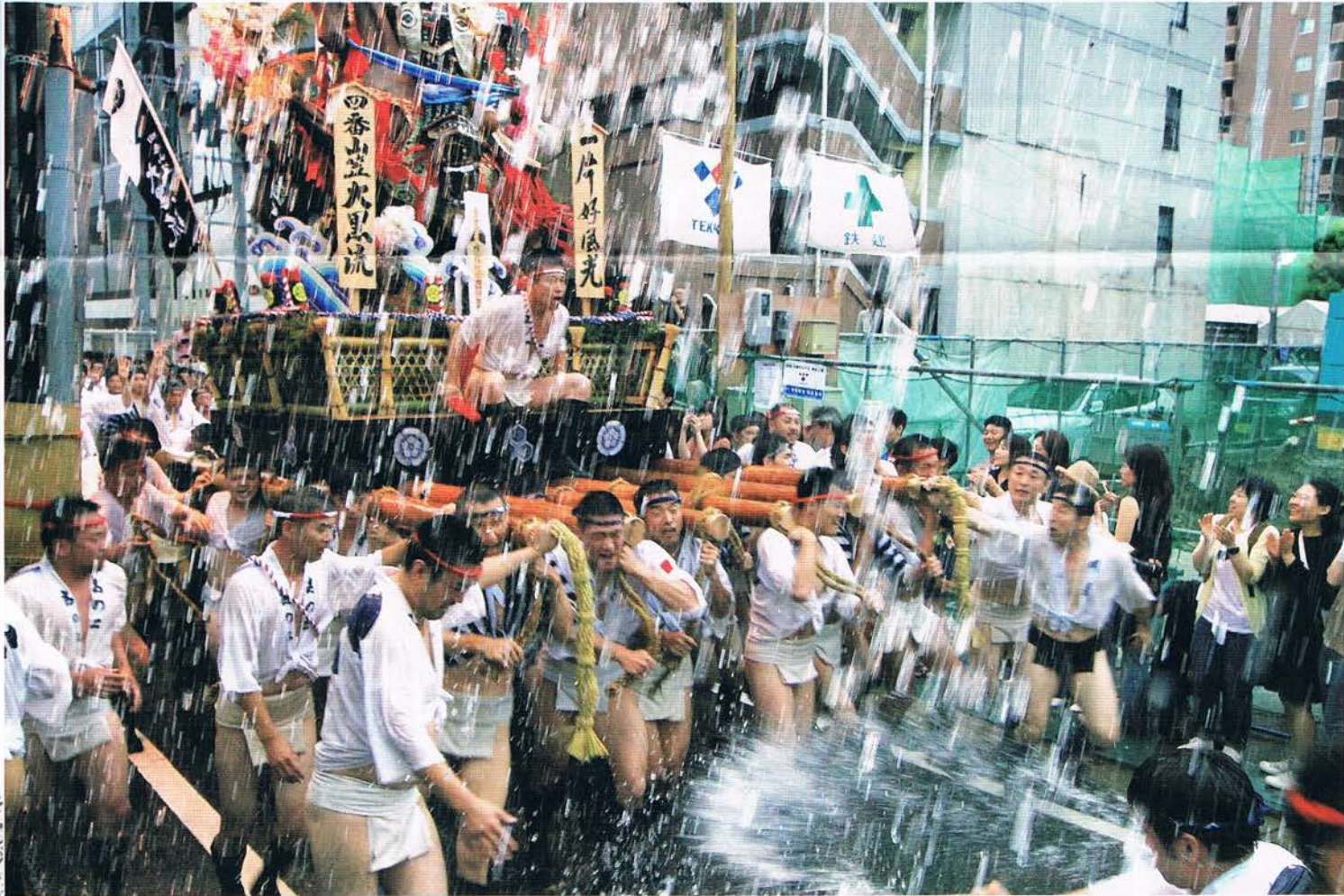
「2019年の博多山笠」

〒810-0041 福岡市中央区大名2丁目7番11号 TEL 092-721-1425 FAX 092-721-1498